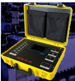
ICON DK-100 ポータブル指圧計測器