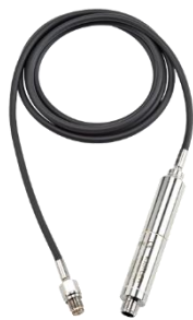
6613CG2 M10筒内圧センサー 2-stエンジン用