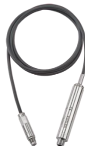
6635A1 M10筒内圧センサー 4-stエンジン用