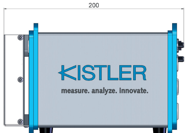
Bild 1: Front- und Seitenansicht der KiRoad Performance Elektronikeinheit