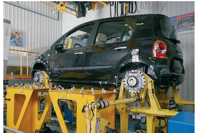
Bild 2: RoaDyn S625 System 2000 non-spinning am Fahrzeugprüfstand