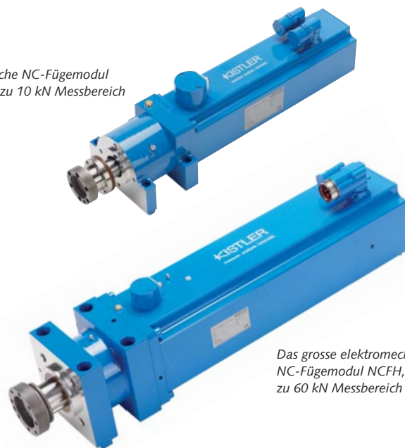
Das grosse elektromechanische NC-Fügemodul NCFH, Typ 2151B... für bis zu 60 kN Messbereich bei 400 mm Hub