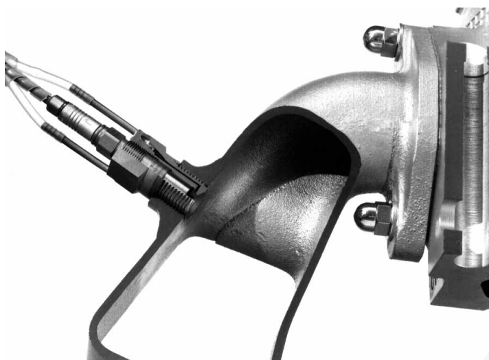
Fig. 1 Sensoreinbau im Einlasskanal Capteur monté dans canal d'admission Sensor installation in an inlet line

Sowohl statischer als auch dynamischer Druck lassen sich mit den piezoresistiven Sensoren Typen 4045 / 4075 von KISTLER messen: